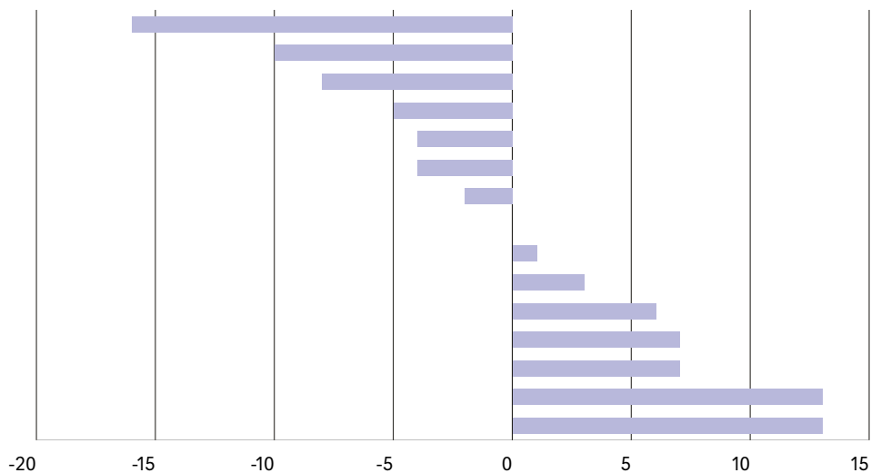
Procentvis udvikling i besøgstal fra 2022–2023 fordelt på de 15 VPAC-institutioner

I gennemsnit havde hver VPAC 113.000 gæster i 2023. Til sammenligning er det et højere niveau end de 97 statsanerkendte museer, der i 2023 havde et gennemsnitligt besøgstal på 100.000 gæster. VPAC-institutionerne placerer sig dermed som vægtige kulturinstitutioner i turisme- og kulturlandskabet med en betydelig attraktionskraft.